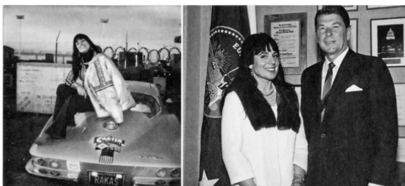
Corvetten alkuperäiset Kalifornia "RAKAS" -kilvet vuodelta 1978, juuri ennen auton laivautusta Suomeen.